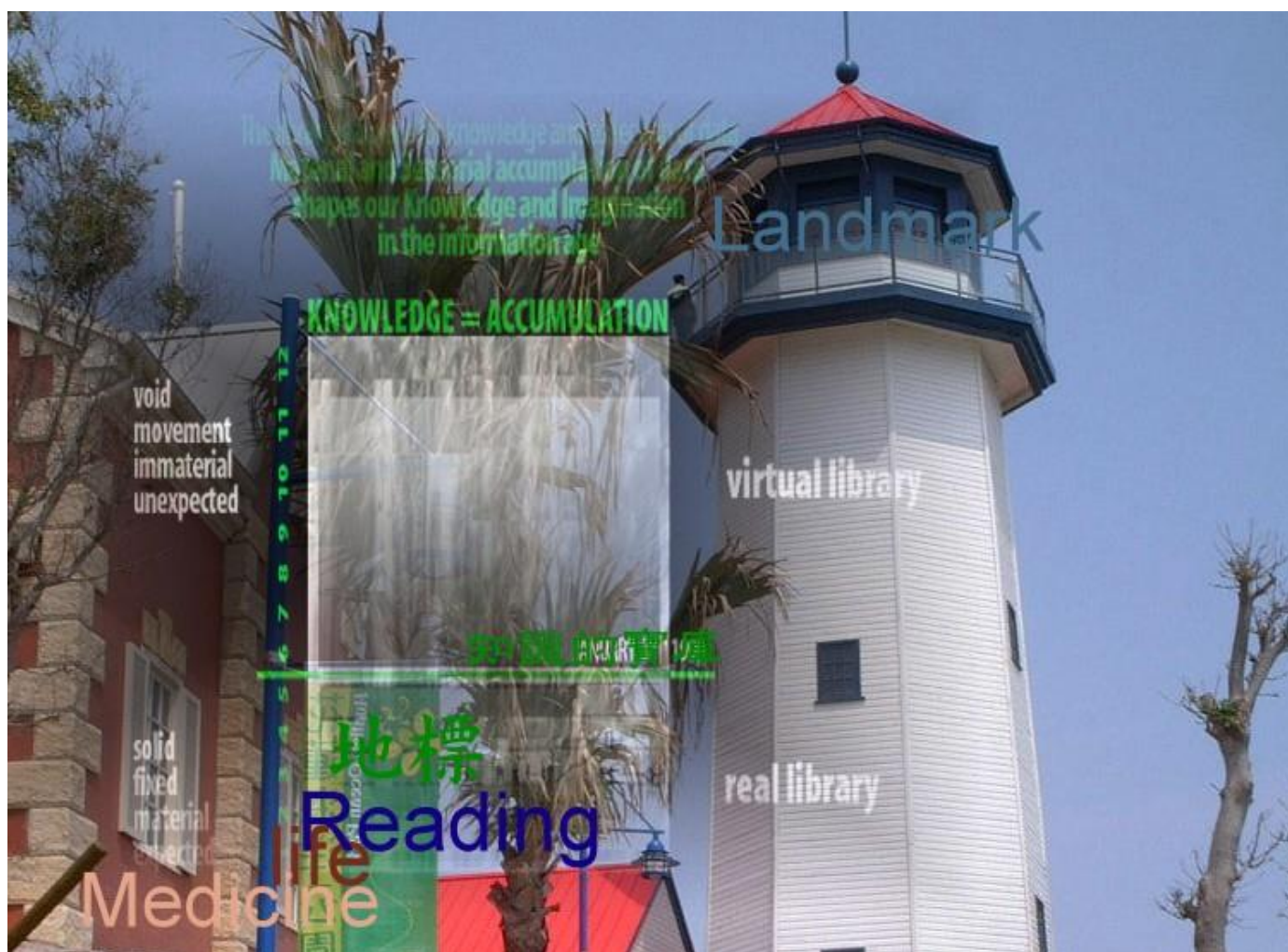
圖片說明：圖書館作為知識的寶藏且可為地標

馬偕醫學院圖書館在校園規劃圖上之區位，應設立於校園重心顯眼處，方便師生到達且容易使用，同時建築基地面積應大，以備後續擴張成長。在設計圖書館建築時有下列觀點值得馬偕師生的注意並形成共識。