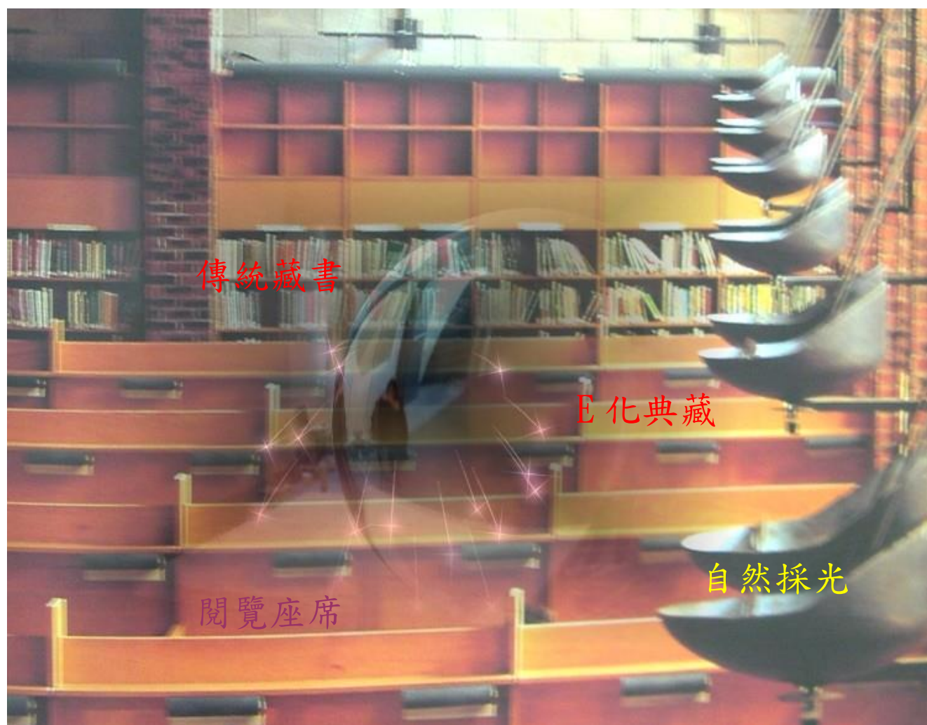
圖片說明：藏書、座席、服務人力將影響圖書館功能之發揮

座向，如何採納綠建築及生態校園理念於建築量體及開窗採光設計，同時圖書館建築如何與周遭教學大樓能有不受天候影響之聯繫與服務，將是建築設計中的重要考慮。