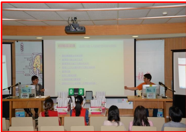
2016 金資獎，決賽—高手對決