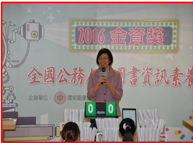
2016 金資獎開幕，由國家圖書館曾淑賢館長致詞