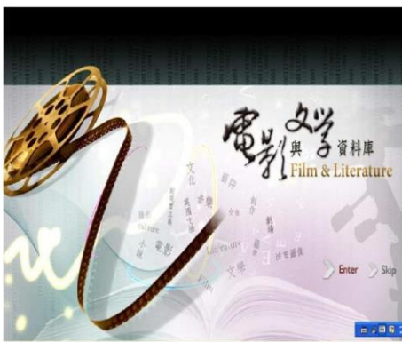
電影與文學資料庫首頁

主要在於介紹幾個自建資料庫及數位體驗區成立的過程及國中圖如何推廣數位資源，國中圖自建資料庫包含圓夢繪本資料庫(100.12)-收錄台中市明道高中美術班學生的繪本作品、電影文學資料庫(100.07)-收錄電影及電影文學與相關影評賞析、設計師之手-數位設計創作展示平台(101.06)-收錄大專校院學生文創數位典藏作品。