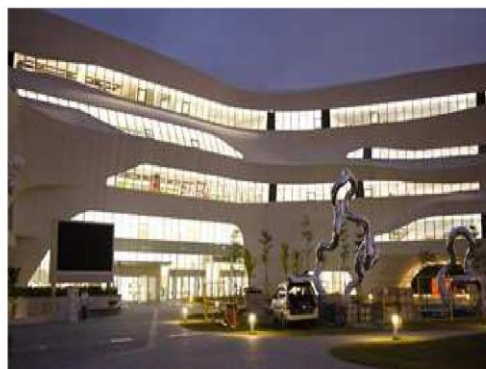
國立臺中圖書館館舍夜間散發閃亮光芒。